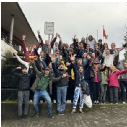
Basiskurs Wolfs- und Pfadistufe 2023