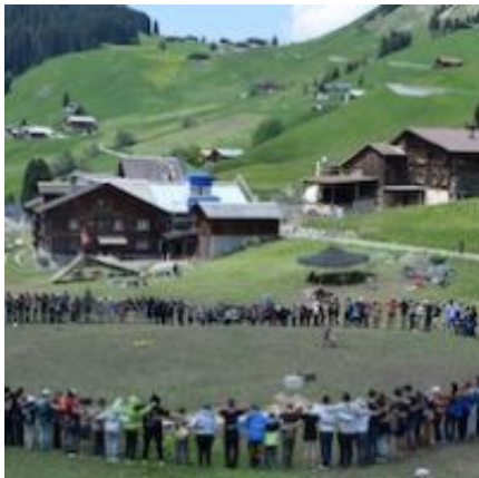
PfiLa - Hinter dem Mond links