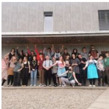
Rückblick Aufbaukurs GR/SH 251-23